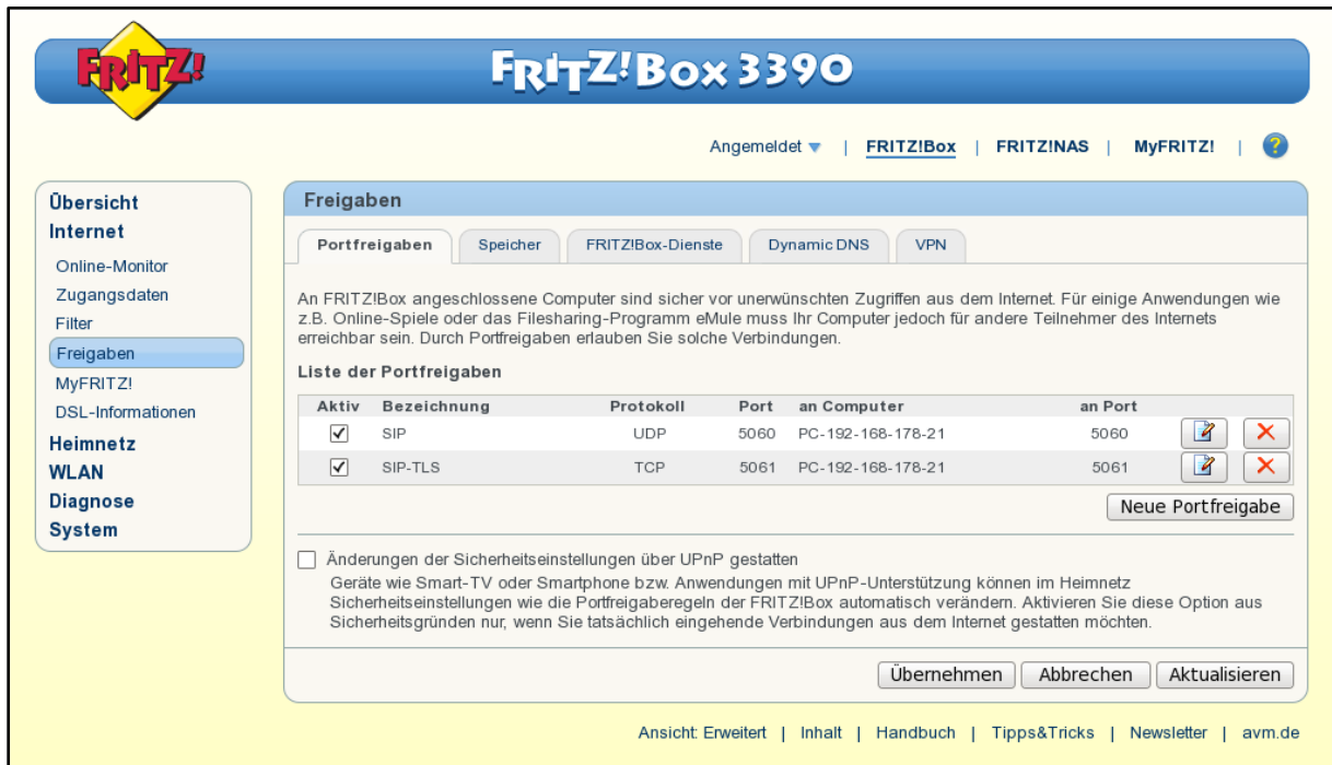
Abbildung 2 - Beispiel für die 2 eingerichteten Portfreigaben