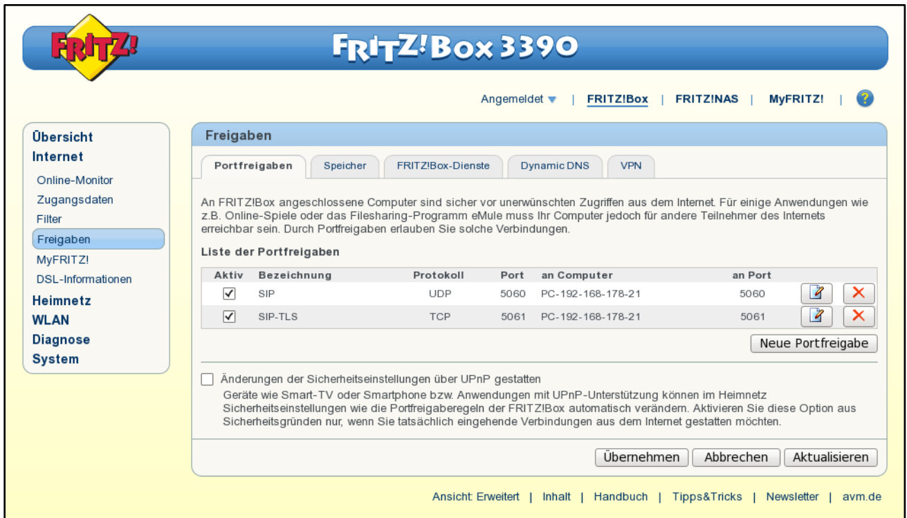
Abbildung 2 - Beispiel für die 2 eingerichteten Portfreigaben