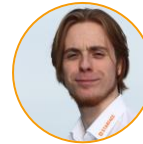
Mavel Porte Gewehr